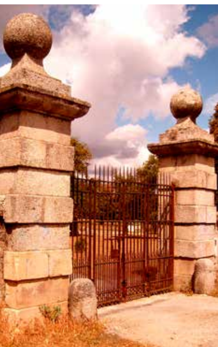
Puerta de El Goloso