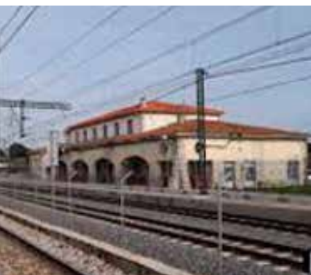
Estación de cercanías de El Goloso