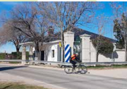
Portillera de El Tambor

Portillera de El Tambor (kilómetro 12,3). Finaliza el largo y monótono tramo pegado a la tapia y llegamos a la carretera de Fuencarral a El Pardo. Giramos a la derecha y pasamos por la portillera que da acceso a El Pardo. A partir de aquí y hasta el final de la ruta se comparte trazado con la Ruta Verde RV-09.