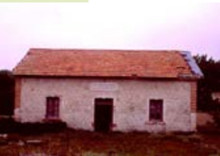
Estación de Chavarrí

Km. 23. Llegamos a Perales del Río. La Vía Verde rodea por el sur el casco urbano del municipio ya que el trazado ferroviario original se ha perdido. El carril bici nos permite llegar fácilmente bajo el trazado de la A-3 que cruzaremos de nuevo, esta vez en dirección a Tielmes. Justo en este punto y sobre unos acantilados de yeso podemos ver las celebres viviendas-cueva excavadas hace cientos de años.