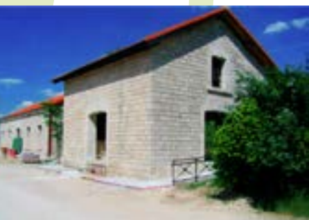
Estación de Ambite

Km. 40. Estamos en Orusco, otro de los pequeños y hospitalarios pueblos del valle, desde aquí y hasta llegar a Ambite vamos a disfrutar de uno de los mas bonitos tramos de la Vía Verde.