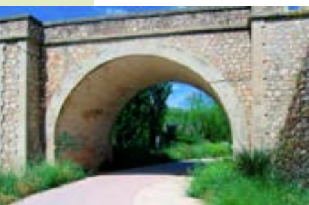
Puente de Orusco

Km. 30. Hace un buen rato que hemos dejado atrás el casco urbano de Tielmes así como una pequeña ermita junto a la ruta. Mas adelante y junto a la carretera es posible ver el edificio de la antigua estación de Chavarrí que daba servicio al balneario y planta embotelladora de las célebres “Aguas de Carabaña”.