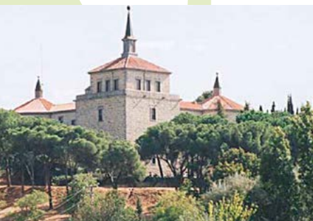
Castillo de Villaviciosa de Odón

La Venta de la Rubia y Retamares. Gracias a la existencia de terrenos dedicados a maniobras militares y a la presencia de grandes cuarteles junto a la A5 el crecimiento urbanístico de esta zona ha sido lento y gracias a esta circunstancia en la actualidad existe un enorme espacio vacío que conecta la Casa de Campo con zonas semi-rurales como la “Venta de la Rubia”, un enclave donde hay diversas explotaciones hípicas y deportivas como el Club San Jorge.