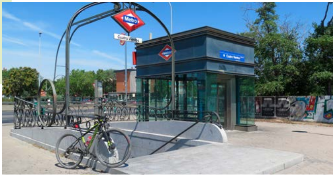
Estación de Metro Cuatro Vientos

La ruta comienza y finaliza en dos importantes paradas de la línea C5 de Cercanías, uno de los corredores de transporte más usados por los habitantes de esta populosa zona de Madrid. Además, en Cuatro Vientos, también hay conexión con la línea 10 de Metro de Madrid así como autobuses urbanos de la EMT.