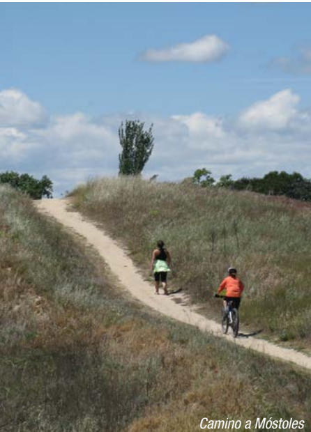
Camino a Móstoles