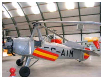
Museo del Aire