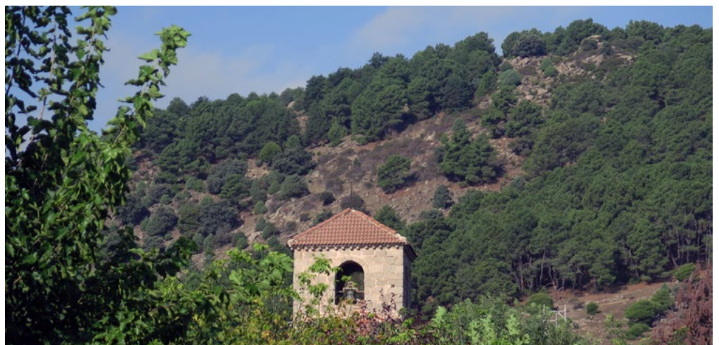
Laderas de Cabeza Mediana