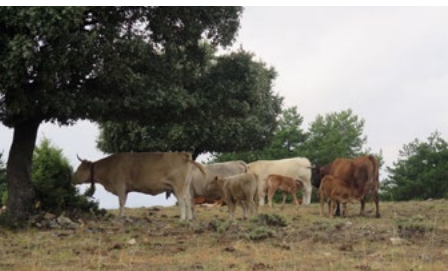
Ganado en Cabeza Mediana