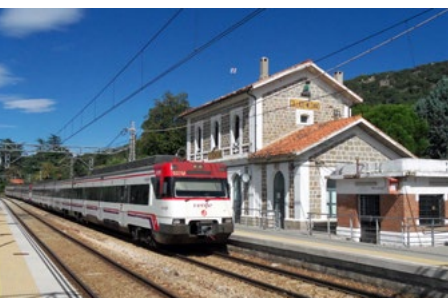
Estación de Collado Mediano