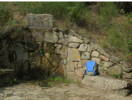
Fuente del Retén