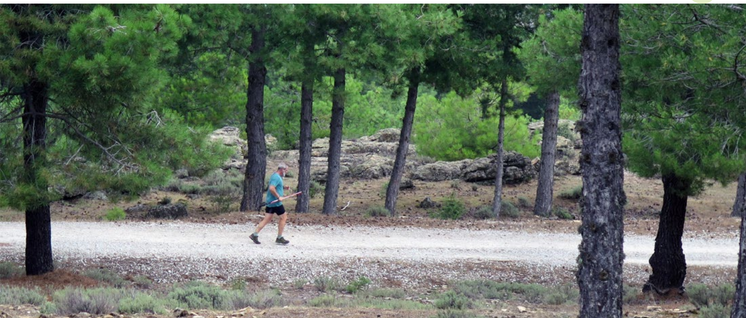
Pista de Cabeza Mediana