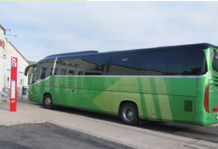
Estación de Autobuses Moralarzal

Te vamos a invitar a realizar una ruta con un encanto especial ya que nos va a permitir disfrutar de unas vistas privilegiadas de la Sierra y a la vez va a suponer un aprendizaje sobre la historia de las telecomunicaciones y de cómo era el mundo antes de la llegada del teléfono. Coge tu mochila, llena tu cantimplora y sube con nosotros a Cabeza Mediana.