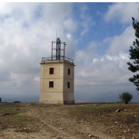
Torre del Telégrafo

de la Granja de San Ildefonso (Segovia) y de Aranjuez. El telégrafo óptico basaba su funcionamiento en la transmisión de señales luminosas entre una red de torres visibles las unas con las otras y separadas al menos entre sí por una distancia de 2,5 leguas (5,58 km). En cada torre podía haber hasta tres torreros que debían estar en alerta permanente. Los mensajes estaban encriptados y se descifraban en el lugar de destino por medio de códigos establecidos. Con el paso de los años esta torre pasó a formar parte de la línea de telegrafía Madrid-Valladolid-Burgos y dejó de funcionar en 1852, cuando entró en servicio el telégrafo eléctrico que permitía transmitir de día, de noche o en los días nublados.