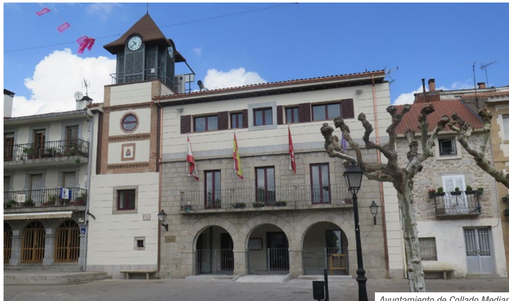
Ayuntamiento de Collado Mediano

Rotonda de la carretera M-601 (kilómetro 10,5). Cruce de Collado Mediano. Desde aquí iremos en dirección a Collado Mediano por la carretera M-683 pasando junto a un supermercado y la Urbanización Montecollado.