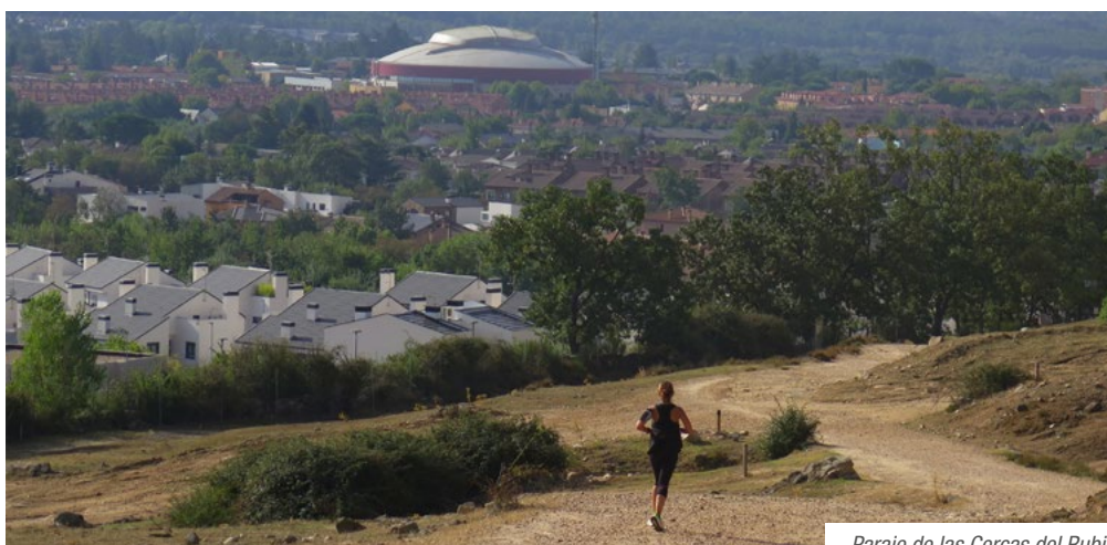
Paraje de las Cercas del Rubio