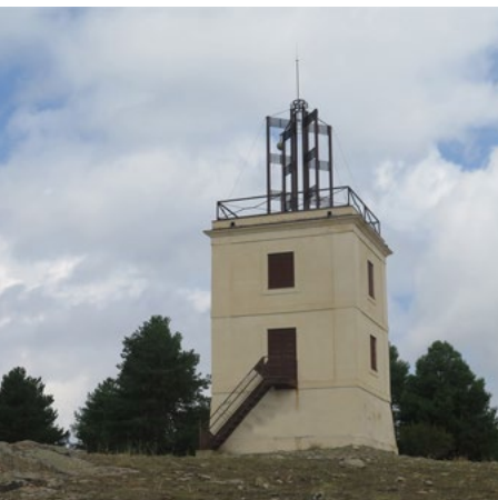
Torre del Telégrafo