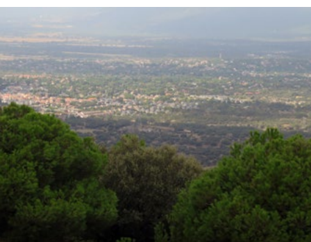
Panorámica de los pueblos