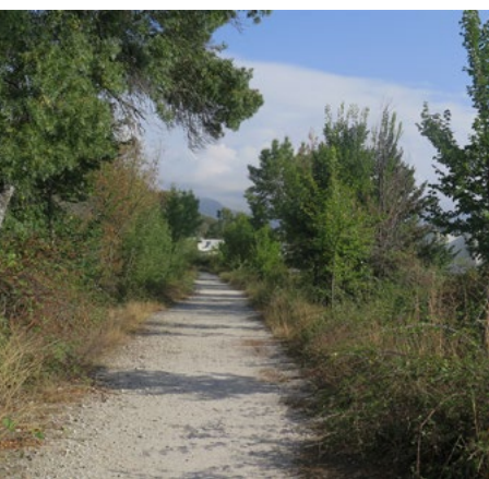
Comienzo de la pista

Paraje de la Cercas del Rubio (kilómetro 1,8). Cruce y giro a la izquierda, atravesamos una barrera y abandonamos definitivamente Moralzarzal. Comienza la subida a Cabeza Mediana siguiendo siempre la pista principal muy transitada por caminantes y ciclistas.