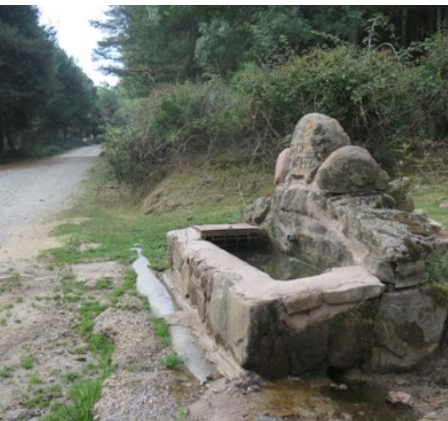
Fuente del Vivero