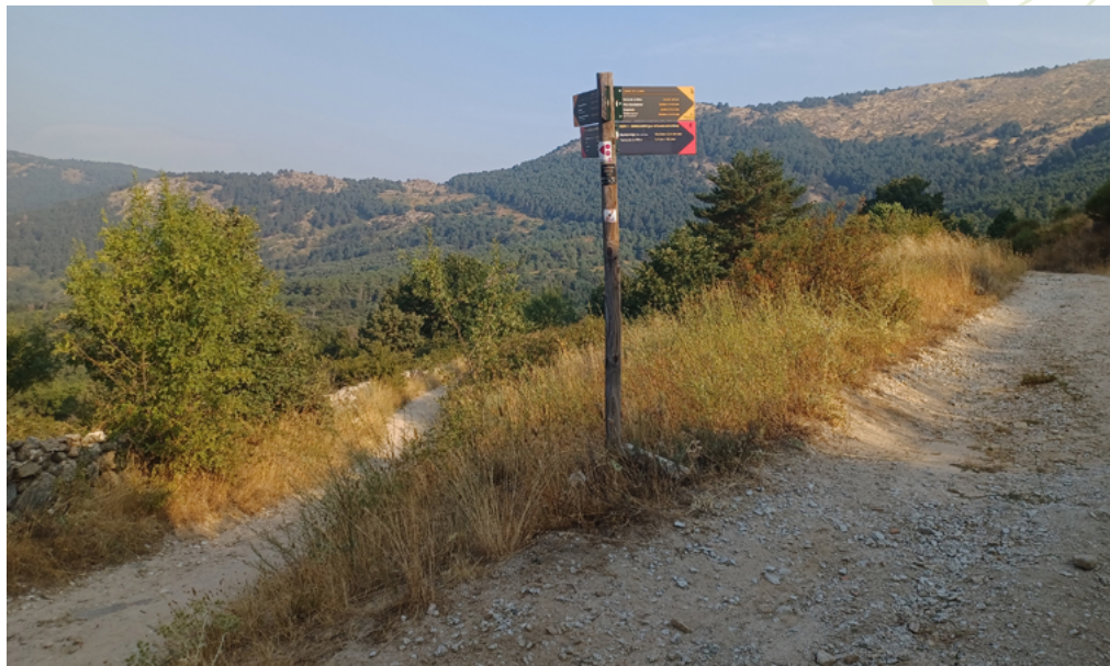
Desvío del sendero a Canencia

Collado Abierto (kilómetro 4,5). Se trata de un tradicional sitio de pastos donde veremos vacas y -sobre todo- caballos. La valla de alambre que transita por el cordal delimita los territorios de Bustarviejo y Canencia, aunque una puerta permite atravesarla. Para seguir hacia el Mondalindo seguiremos por la senda que va por el cordal y paralela a la valla (siempre a nuestra izquierda). La subida es muy cómoda y las vistas excepcionales.