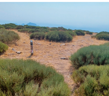
Desvío de bajada a Bustarviejo