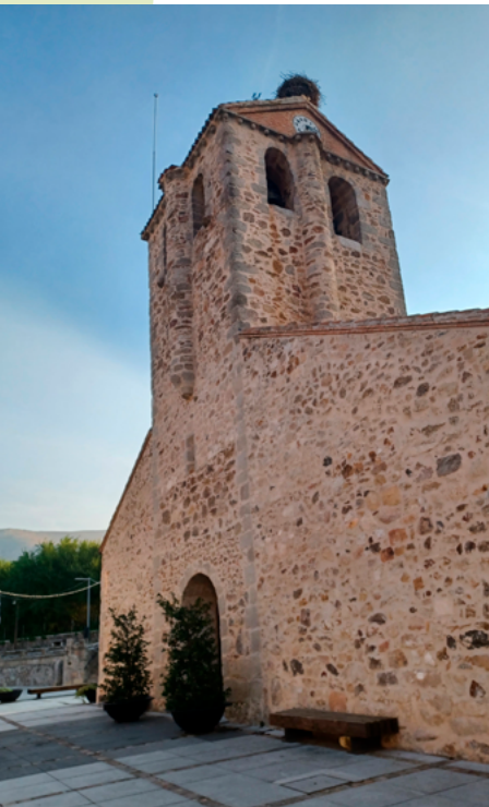
Iglesia de Buitrago

Bustarviejo. Pequeño municipio de montaña ubicado en un paso estratégico de la Cañada Real Segoviana entre el valle del Lozoya y la ladera meridional de Guadarrama. De hecho, en la ruta RV 07.11 recorreremos dicha vía pecuaria. En Bustarviejo destaca el entorno de su Plaza Mayor con la iglesia de la Purísima Concepción y el propio edificio del Ayuntamiento.