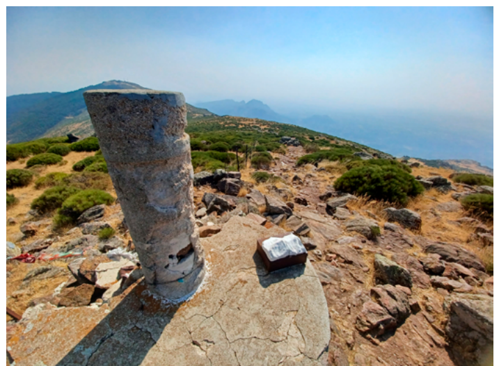
Mina de plata Pico Mondalindo