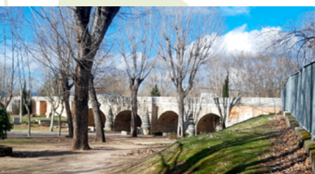
Puente de San Fernando

Entrada al campo de Golf de Puerta de Hierro (kilómetro 8,9). Cruzamos y seguimos el camino de tierra.