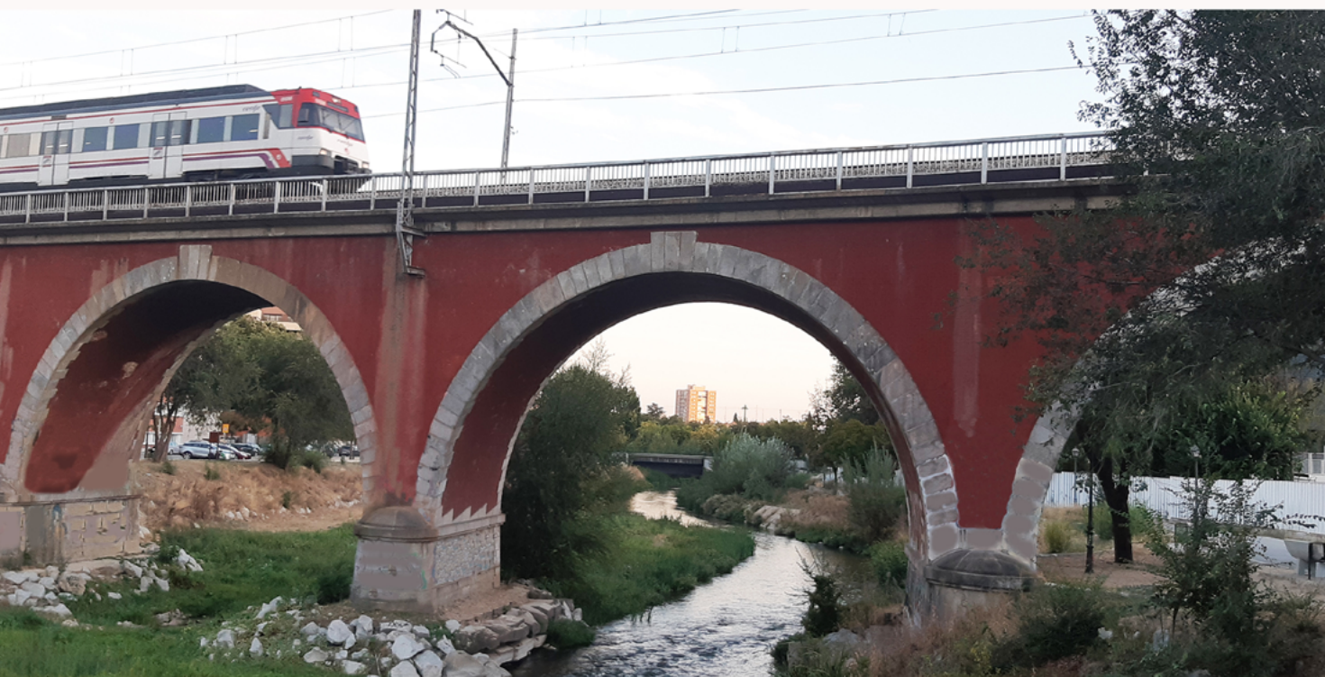
Puente de los Franceses

Puente del Rey (kilómetro 14,5). Final de la ruta. Hasta llegar al intercambiador de Príncipe Pío tenemos unos 300 metros adicionales.