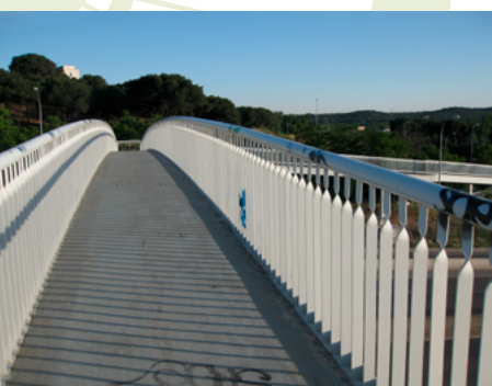
Pasarela sobre la calle Sinesio Delgado

Biblioteca de la UNED (kilómetro 11,5). Seguimos recto con los edificios universitarios a la izquierda y la M-30 a la derecha.