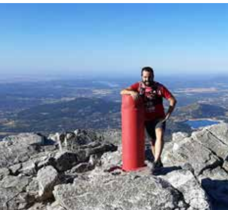
Cima de La Maliciosa