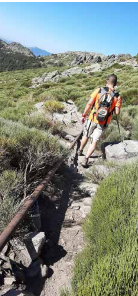
Camino de las tuberías