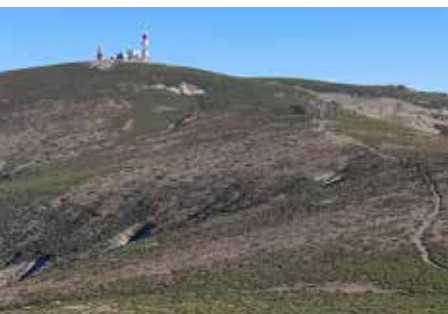
Bola del Mundo