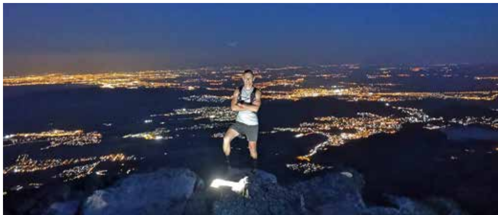
Visión nocturna desde la cima de la Maliciosa

La Maliciosa. El fuerte desnivel de su cara sur y su rotunda morfología hace que sea un pico reconocible desde la ciudad de Madrid. Su perfil gris azulado salpicado de neveros sirvió de telón de fondo para que Velázquez pintara el retrato del príncipe Baltasar Carlos a caballo. En el siglo XV aparece la denominación de “La Maldecida” para una cumbre atacada por los vientos y la nieve en invierno y por el implacable sol del verano. Estamos, sin duda, ante la cima más legendaria y uno de los mejores miradores de Guadarrama.