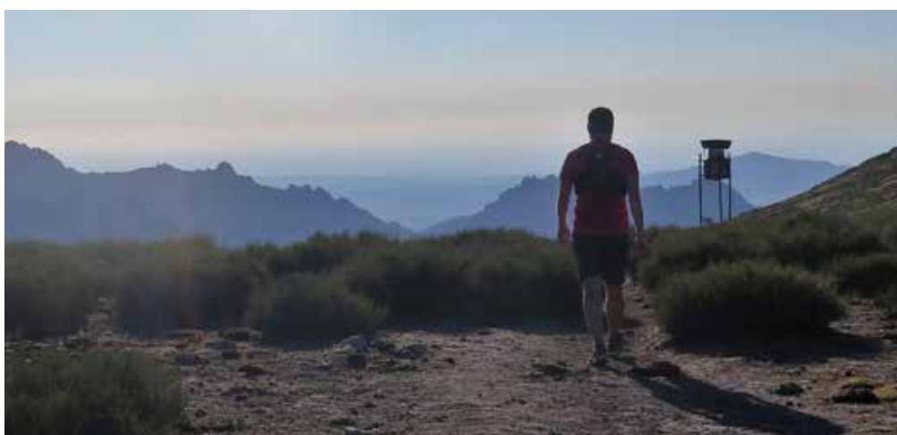
Collado del Piornal

Fuente de la Campanilla (kilómetro 6). Abandonamos definitivamente la pista justo a la altura del monolito que marca la entrada al Parque Nacional de Guadarrama. Giramos a la derecha, ascendemos por el sendero y nos refrescamos en la fuente de la Campanilla. Comienza la dura subida por sendero hasta el collado del Piornal.