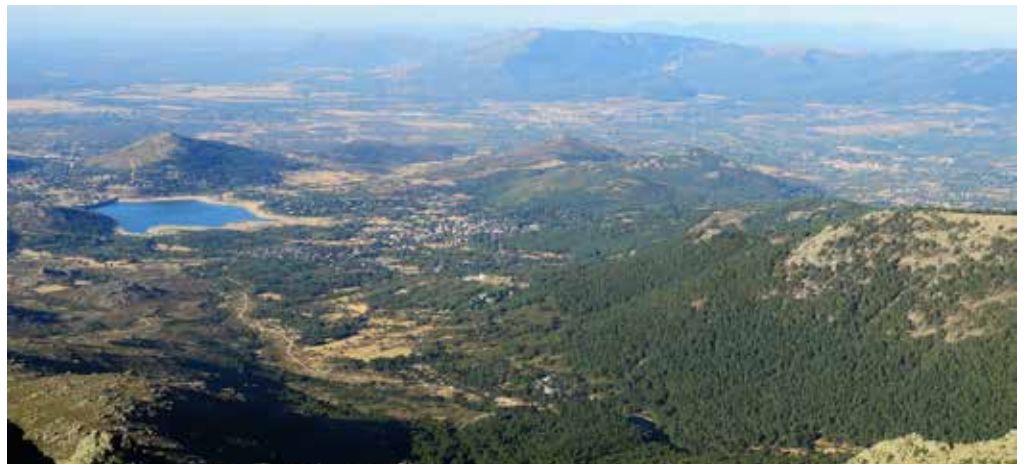
Valle de La Barranca

Utilizaremos, tanto al comienzo como al final de la ruta, los servicios de las líneas interurbanas del Consorcio Regional de Transportes. Desde Madrid al pueblo de Navacerrada viajaremos en la línea 691 (Grupo Avanza) que parte del Intercambiador de Moncloa.