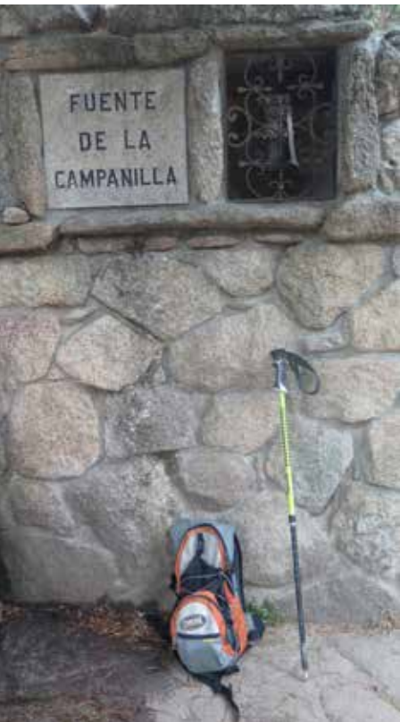
Fuente de la Campanilla