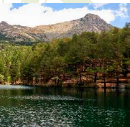
Valle de La Barranca

Desvío cresta de las Cabrillas (kilómetro 12,8). En una amplia curva abandonamos la pista hormigonada y giramos a la izquierda para bajar por un sendero que se encamina a la “Cuerda de las Cabrillas” una alineación montañosa que separa el valle de la Barranca del valle del Regajo del Puerto por donde discurre la M-601.