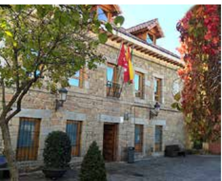
Ayuntamiento de Navacerrada

Navacerrada (kilómetro 0). Partimos de la plaza del Ayuntamiento en dirección a la calle de las Eras. En esta misma calle se encuentra la terminal de la línea 691. Salimos del pueblo cruzando la rotonda de la M-607.