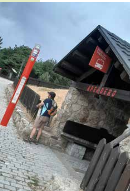
Parada de la línea 691. Puerto de Cotos.

Además de la propia ruta a pie, a lo largo de la excursión tendremos la oportunidad de conocer enclaves muy interesantes desde el punto de vista medioambiental y paisajístico.