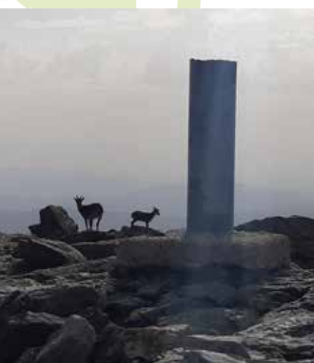
Cabras Montesas. Pico Peñalara

El Puerto de Cotos o del Paular. Se trata de un histórico paso de montaña que a lo largo de los siglos comunicó el valle de Valsain donde se encuentra el palacio de La Granja y el valle del Lozoya (El Paular). La conexión a Navacerrada por carretera y ferrocarril es, sin embargo, mucho más moderna. El topónimo “Cotos” alude a la presencia de unos mojones de piedra, denominados de esa manera que marcaban cada cierto tiempo el trazado del camino para hacerlo visible durante la época de nevadas. En el puerto, a 1830 metros de altitud, encontraremos la estación de ferrocarril, el chalet del Club Alpino Español, la histórica Venta Marcelino y un centro de información del Parque Nacional de Guadarrama.