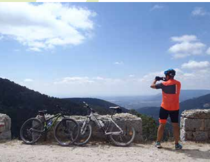
La Fuenfría. Camino de Santiago desde Madrid

50 estaciones de Metro, Metro Ligero y Cercanías como punto de partida y final de las rutas. Más de 40 estaciones como punto de paso.