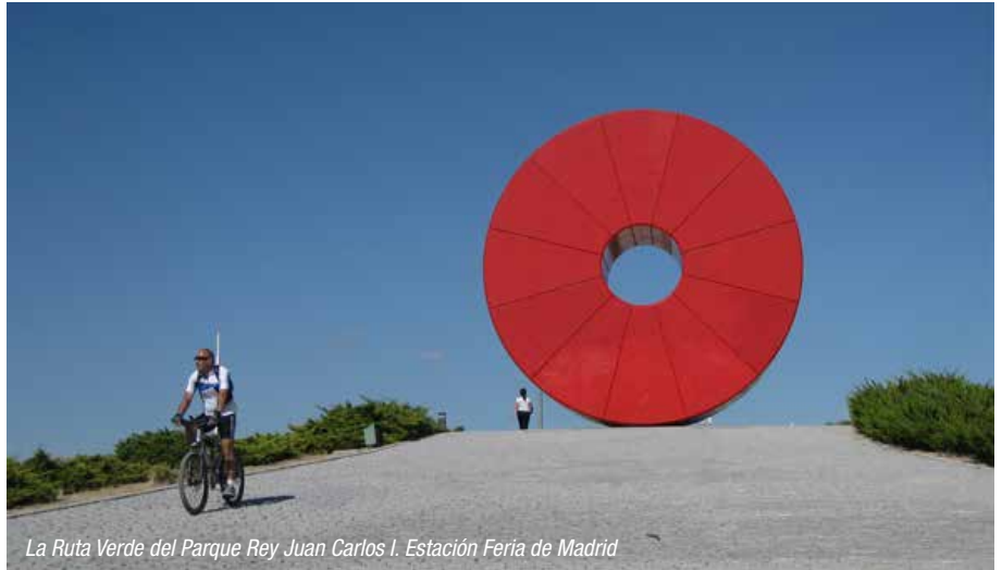
La Ruta Verde del Parque Rey Juan Carlos I. Estación Feria de Madrid