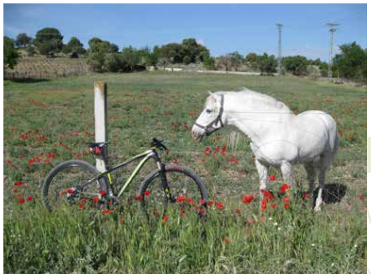
En el valle del Guadarrama. Ruta de Móstoles a Sevilla la Nueva

Todos los itinerarios y sus respectivos libros de ruta están disponibles en la página web del Consorcio Regional de Transportes www.crtm.es