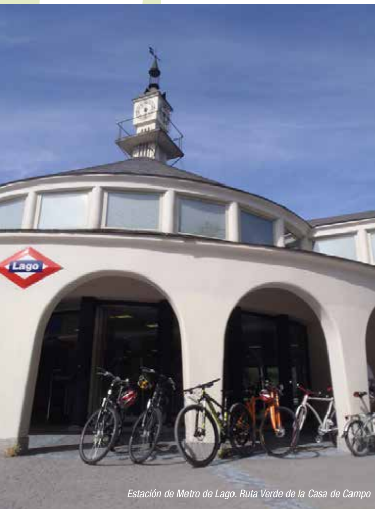
Estación de Metro de Lago. Ruta Verde de la Casa de Campo

Numerosas estaciones de la red de transporte público de la Comunidad de Madrid que están ubicadas en las proximidades de algunos de estos espacios naturales pueden ser el punto de partida para disfrutar de una jornada de ocio activo. El Consorcio Regional de Transportes (CRTM) creó en 2011 las llamadas “estaciones de acceso a Ruta Verde”, puntos de la red de transporte donde se pueden comenzar rutas muy sencillas, aptas para todos los públicos y que ponen en valor rincones y facetas desconocidas de la región.