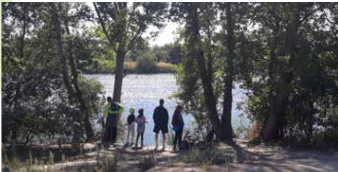
Laguna del Soto (a 15 minutos de la estación de Metro de Rivas Vaciamadrid)

A finales del siglo XIX un ferrocarril de vapor de vía estrecha, el popular “Tren de Arganda, que pita más que anda”, atravesaba toda esta zona. Dicho tren tenía su origen en la madrileña estación del Niño Jesús, muy cerca del Retiro. En los años setenta del siglo XX esta línea pasa a ser el ferrocarril de la cementera Portland y en 1998 parte de su trazado se transforma en la actual línea 9 de Metro de Madrid.