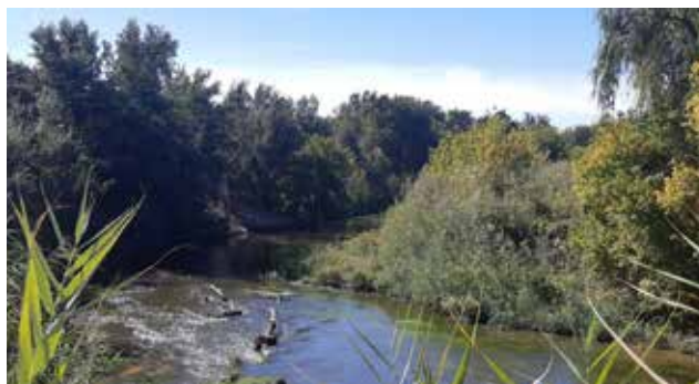
Río Manzanares, metros antes de unirse al Jarama

Estación de Rivas Vaciamadrid (kilómetro 13,5). Final de la ruta. Conexión Rutas Verdes: RV-2.1, RV-2.3, RV-3.1 y RV-3.2.