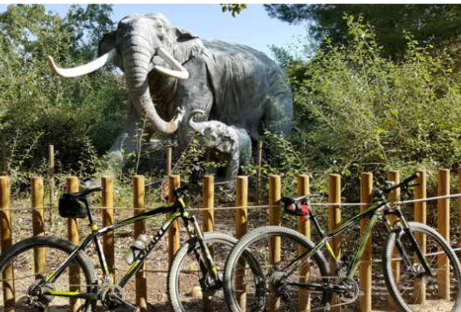
Centro de Interpretación de la Naturaleza

El antiguo Ferrocarril del Tajuña. En el entorno de la laguna del Campillo se ha conservado un tramo del antiguo ferrocarril que es explotado con fines turísticos por la asociación "Vapor Madrid". Su base de operaciones se encuentra en La Poveda donde cuentan con una coqueta estación, taller de restauración de trenes y un pequeño museo. Viajar en este tren es una actividad más que recomendable si vienes a hacer esta ruta.