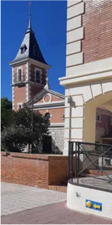
Iglesia de Rivas

Se trata de un excelente lugar para comprender la génesis y funcionamiento de los diferentes ecosistemas de la zona.