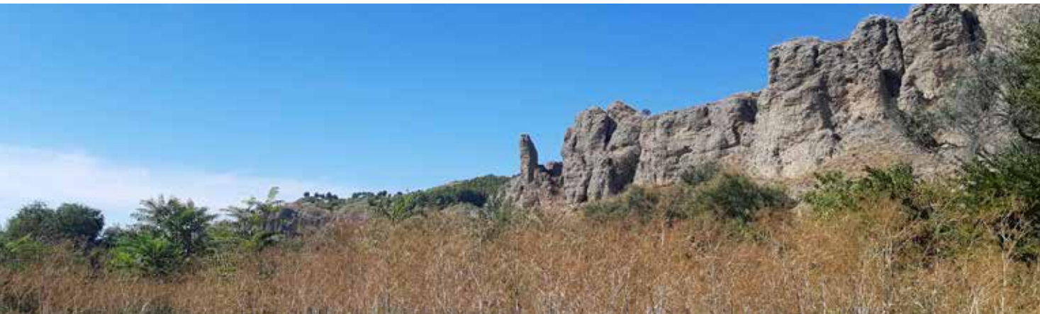
Cortados de La Marañosá