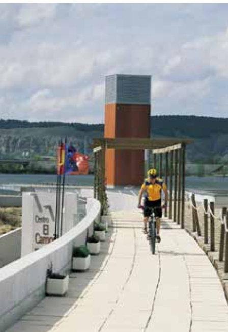
Centro de Interpretación de la Naturaleza

Metro Rivas Vaciamadrid (kilómetro 0). Salimos de la estación dirección su- reste. Atravesamos una rotonda y tomamos una carretera que discurre paralela a la vía del Metro (derecha) y al casco histórico de Rivas (izquierda).