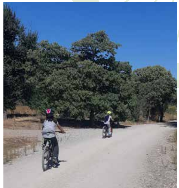
Pedaleando junto al Jarama