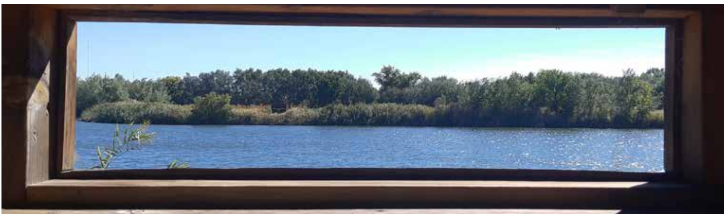
Observatorio de aves en la Laguna del Soto

Desvío al Centro de Interpretación de la Naturaleza (kilómetro 2,7). El ac- ceso a la izquierda nos invita a visitar el CIN de El Campillo. Un espectacular mamut y su cría reciben al visitante. El edificio es muy impactante y su galería acristalada permite tener unas vistas privilegiadas de la laguna. Una vez visita- do el centro volvemos a la entrada y seguimos a la izquierda.