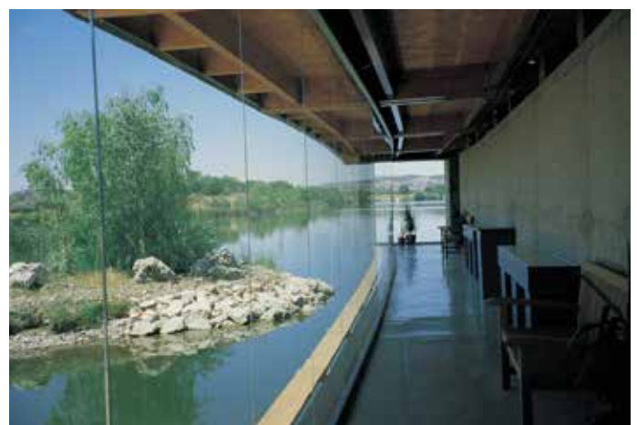
Centro de Interpretación de la Naturaleza