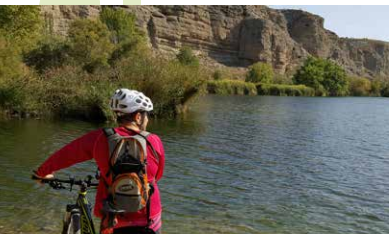
Laguna del Campillo

La Laguna del Campillo. Cuesta trabajo creer que un paraje natural tan bonito es consecuencia de la actividad humana, en concreto de la extracción de grava y arena para la construcción. Justo en su orilla meridional se encuentra el Centro de Interpretación de la Naturaleza de la Comunidad de Madrid.