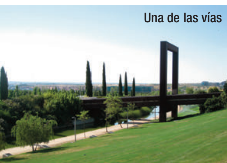
Una de las vías

El palacio Municipal de Congresos. El edificio del Palacio Municipal de Congresos es obra de Ricardo Bofill y fue inaugurado en el año 1993 dentro del contexto urbano del llamado Campo de las Naciones. En la actualidad su gestión recae en la Empresa Municipal Campo de las Naciones. Tiene una superficie de más de 30.000 m 2 sobre un total de 14 plantas con la singularidad de que 7 de las mismas son subterráneas. El edificio es sobrio, funcional y con su fachada de piedra blanca no deja indiferente a nadie. Entre otros eventos ha albergado reuniones de OTAN, la Unión Europea, el FMI o galas festivas como la entrega de los premios Goya.