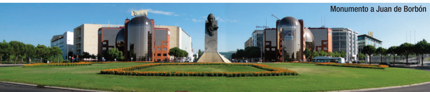
Monumento a Juan de Borbón