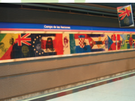
Mural de Campo de las Naciones

La estación de Campo de las Naciones pertenece a la línea 8 de Metro de Madrid y fue inaugurada en 1998 como parte de línea de enlace desde el centro de Madrid al aeropuerto de Barajas. Esta línea se vio ampliada en 2002 con el tramo de conexión a Nuevos Ministerios y completada en 2007 con la extensión por el norte a la Terminal T4 del aeropuerto. Campo de las Naciones es una de las estaciones más singulares de la red, no solo por su funcionalidad y accesibilidad sino también por disponer de un único andén central y sendos murales a cada lado de la vía ocupando toda la longitud de la estación. Se trata de una colorista obra cerámica realizada por Ralph Sardá y Carlos Alonso con el título “Rostros de las naciones, una sola bandera” que además incluye y unifica con gran sensibilidad artística todas las banderas del mundo.